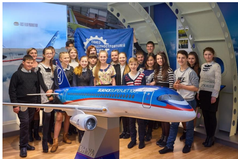
Экскурсия в Экспоцентр КНААЗ