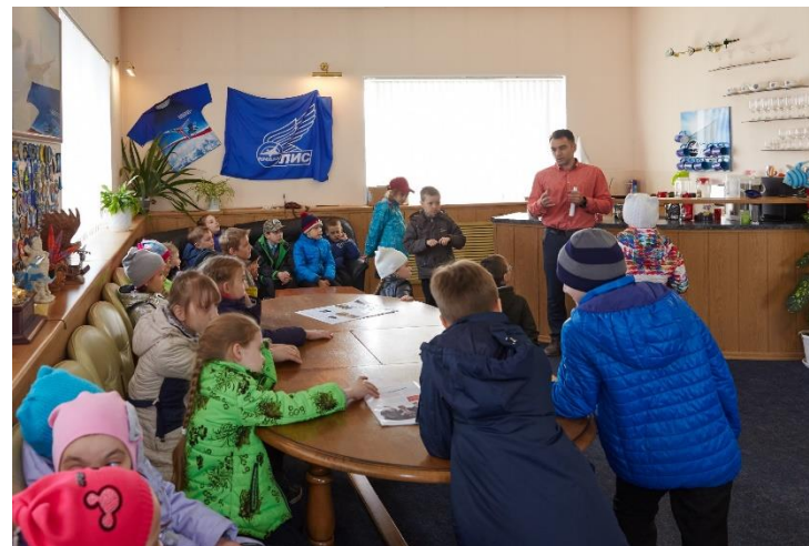
Экскурсия на ЛИС КНААЗ